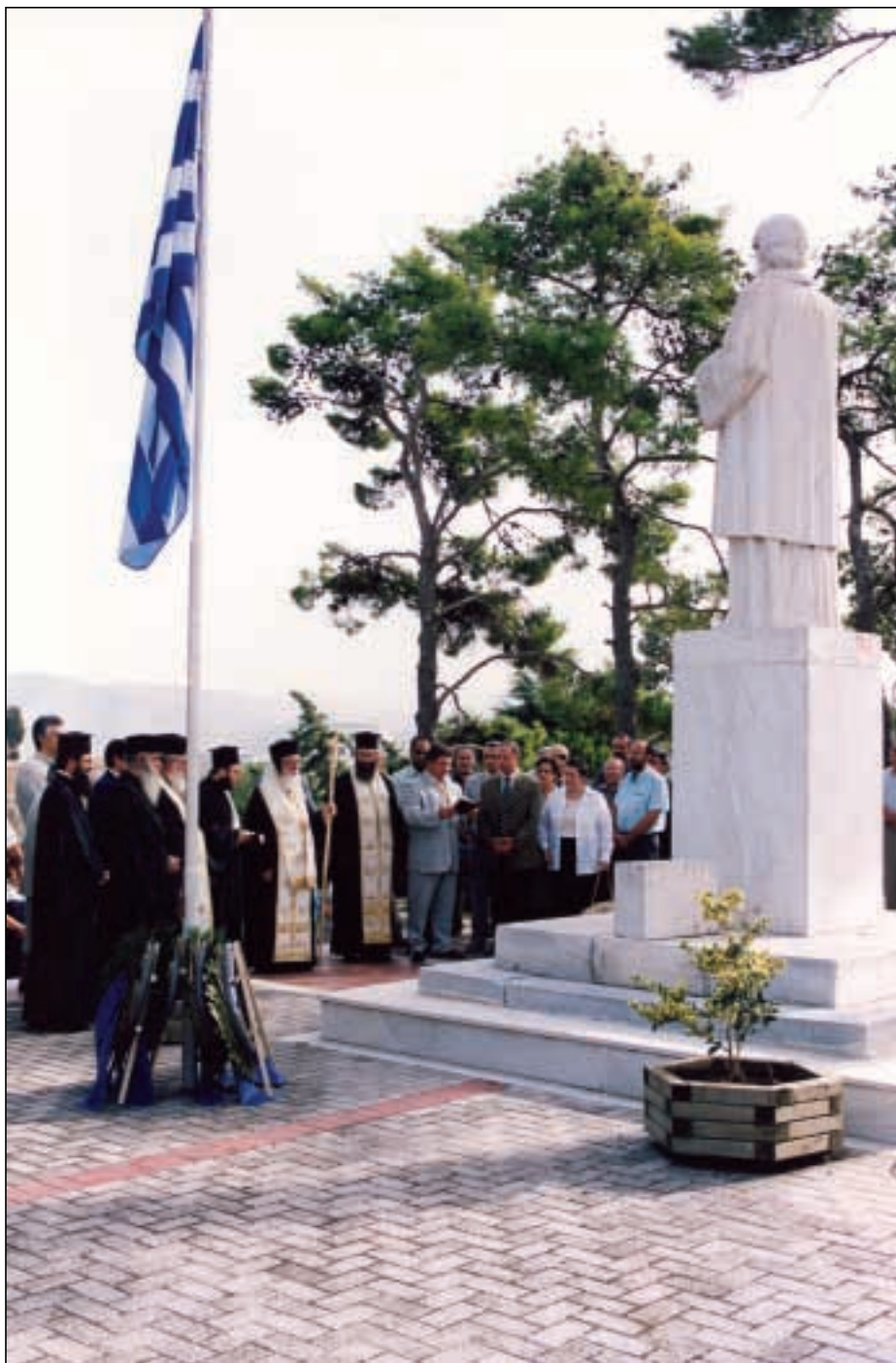
Επιμνημόσυνη δέηση στον ανδριάντα του Ρήγα στο Βελεστίνο χοροστατούντος του Σεβασμιωτάτου Βελεστίνου κ. Δαμασκηνού την Κυριακή 5 Οκτωβρίου 2003 κατά τις εργασίες του Δ' Διεθνούς Συνεδρίου «Φεραί-Βελεστίνο-Ρήγας».