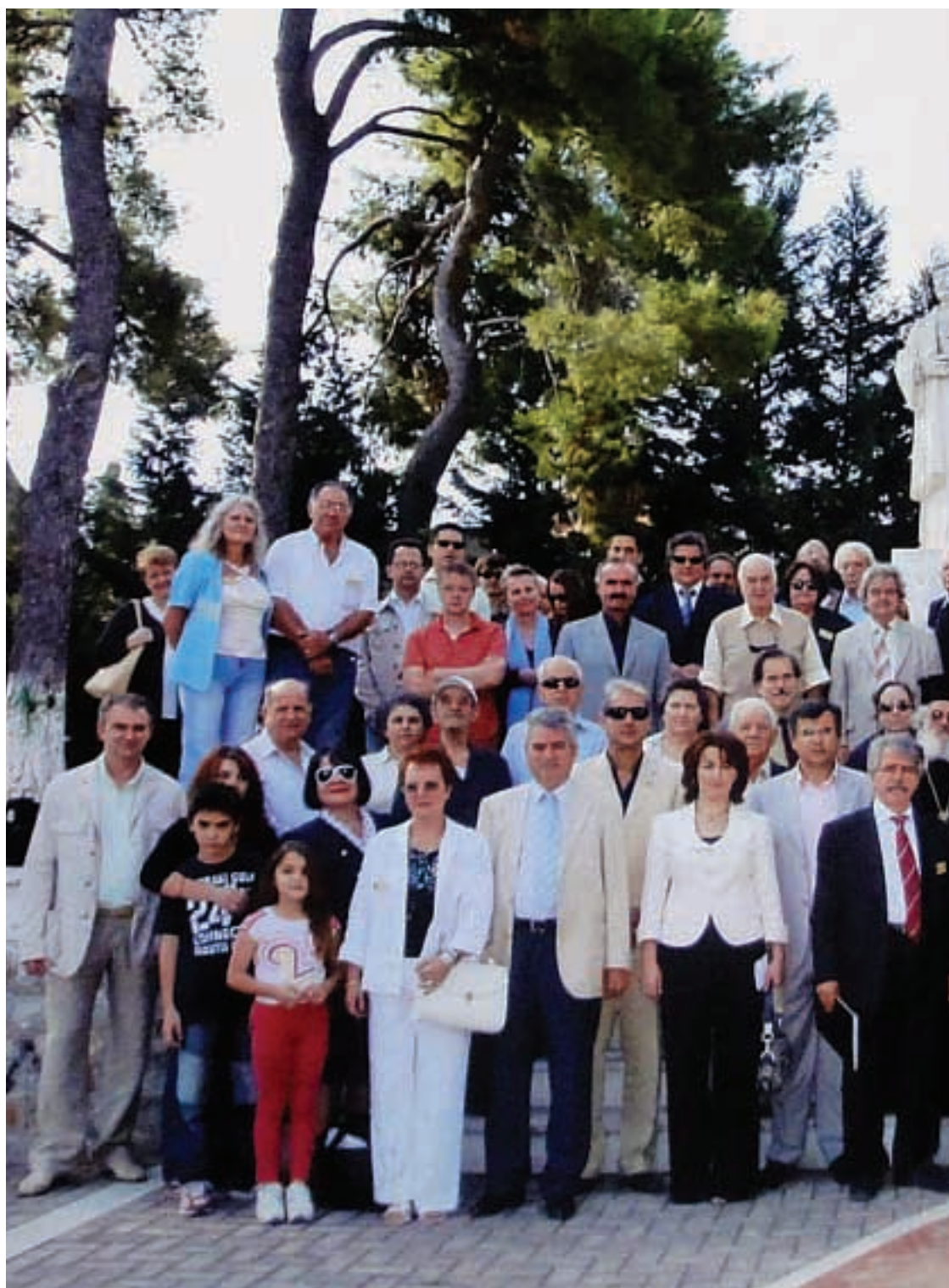
Αναμνηστική φωτογραφία του Σεβασμιωτάτου Μητροπολίτου Βελεστίνου κ. Δαμασκίου, με τους κληρικούς και τους πιστούς της Μητροπόλεως Βελεστίου, την Κυριακή 7 Οκτωβρίου 2007 μετά τη λειτουργία.