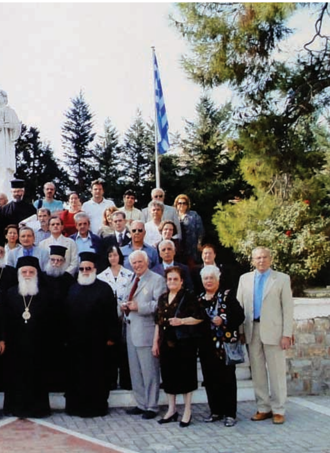
σκηνού με τους Συνέδρους του Ε' Διεθνούς Συνεδρίου «Φεραί-Βελεστίνο-Ρήγας» στην επιμνημόσυνη δέηση στον ανδριάντα του Ρήγα στο Βελεστίνο.